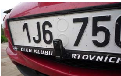
Atraktivní záznam sportovních aktivit