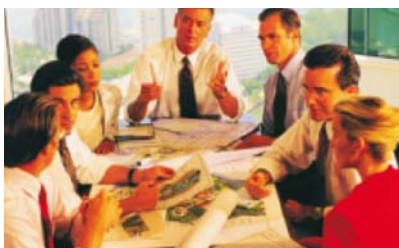
Záznam úředního jednání