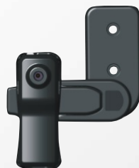
Umístění na stěnu