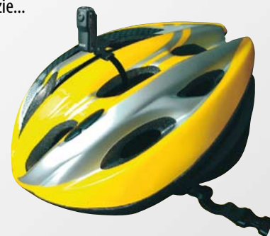
Umístění na přilbu