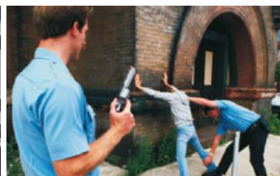
Sbírání a archivace důkazních materiálů