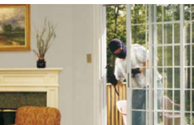
Záznam při podezření z trestné činnosti